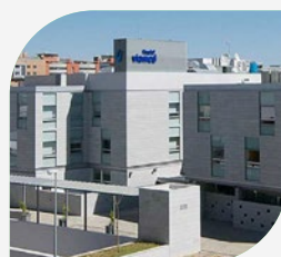
Hospital Viamed Santa Ángela de la Cruz