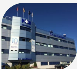
Hospital Madrid Norte Sanchinarro