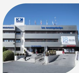
Hospital Madrid Montepríncipe