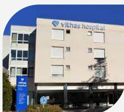
Hospital Vithas Pardo de Aravaca