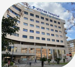
Hospital 9 de Octubre